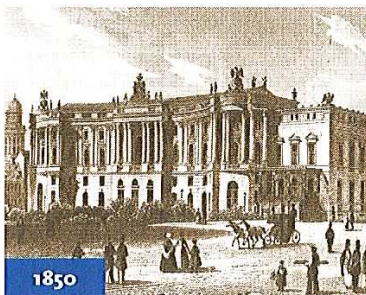
1850 Die Kommode im Wandel der Zeiten

Historische Barockfassade wurde drei Jahre lang restauriert