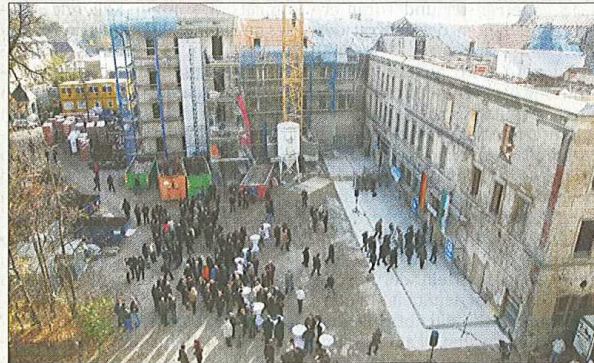
Blick in den Schlossinnenhof. Wo gestern Bauleute, Kreisräte und viele Gäste Richtfest feierten, wird sich künftig der Haupteingang für das neue Landratsamt befinden. Insgesamt werden im Schloss Sonnenstein 500 Büroarbeitsplätze entstehen.