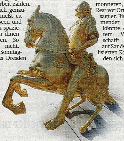
Ende kommender Woche soll sich August wieder mit seinem Schwert wehren können.