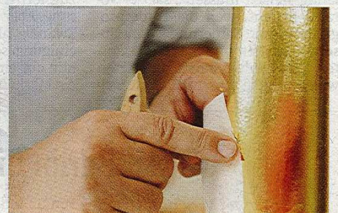
Mit Pinsel und dem bloßen Finger tupft der Restaurator das Gold vom Papier auf das Metall.